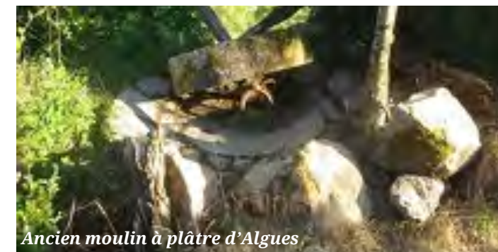
Ancien moulin à plâtre d'Algues